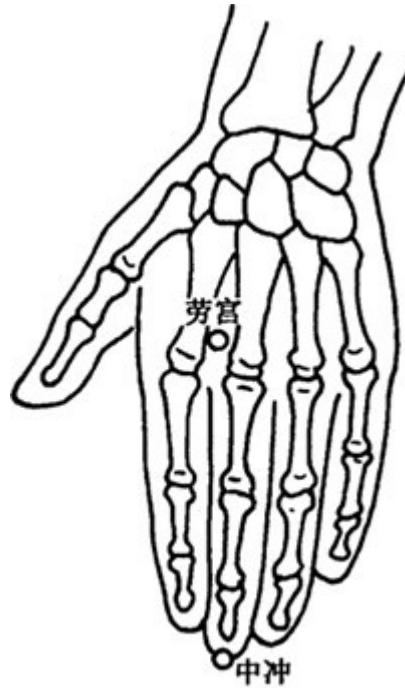
图 3 - 65

Zhong = centro, centrale, medio; Chong = assalto, zampillo.